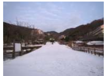
昨年正月のゆずり葉緑地の積雪