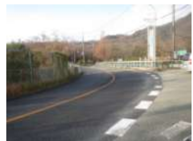
諭鶴羽橋急カーブ