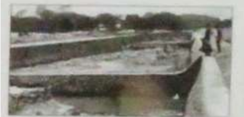
流路工完成当時（昭和9年頃）