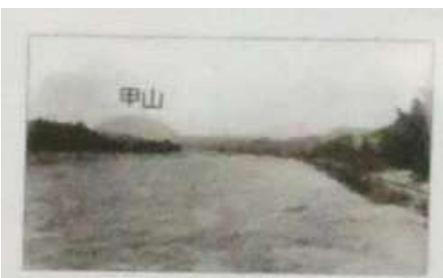
「逆瀬川砂漠」とよばれていた逆瀬川（明治中期）