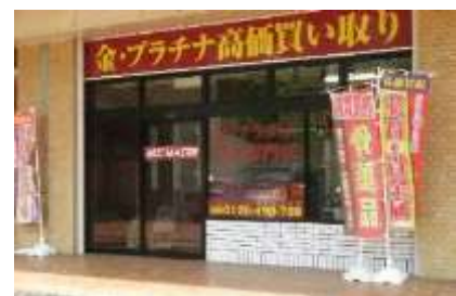
アヴェルデ 4 番館 1 階(駐車場あります)