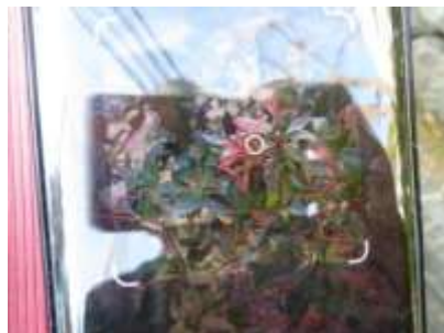
② グーグルレンズの枠内に写す