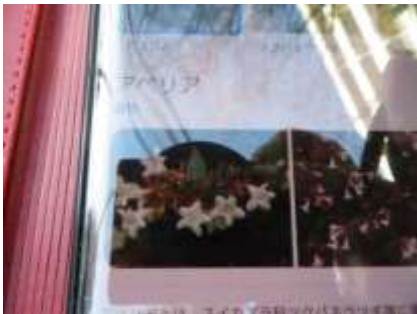
① 候補が表示されます