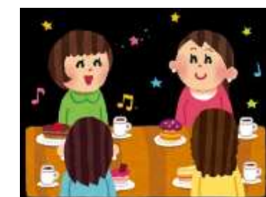
(記 O T)

十一月二十九日(月)午後一時、マンション集会室は『よりみち』としてオープンしました。 『よりみち』には多数の皆さんが集まりました。そして設営された長テーブルの好きなところを自由に選ん